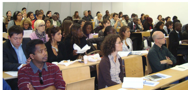
Amphithéâtre D301, Site Carnot

Cette Journée d'études s'est achevée par une table ronde au cours de laquelle les échanges se sont poursuivis entre les intervenants, d'une part, et le public, d'autre part.