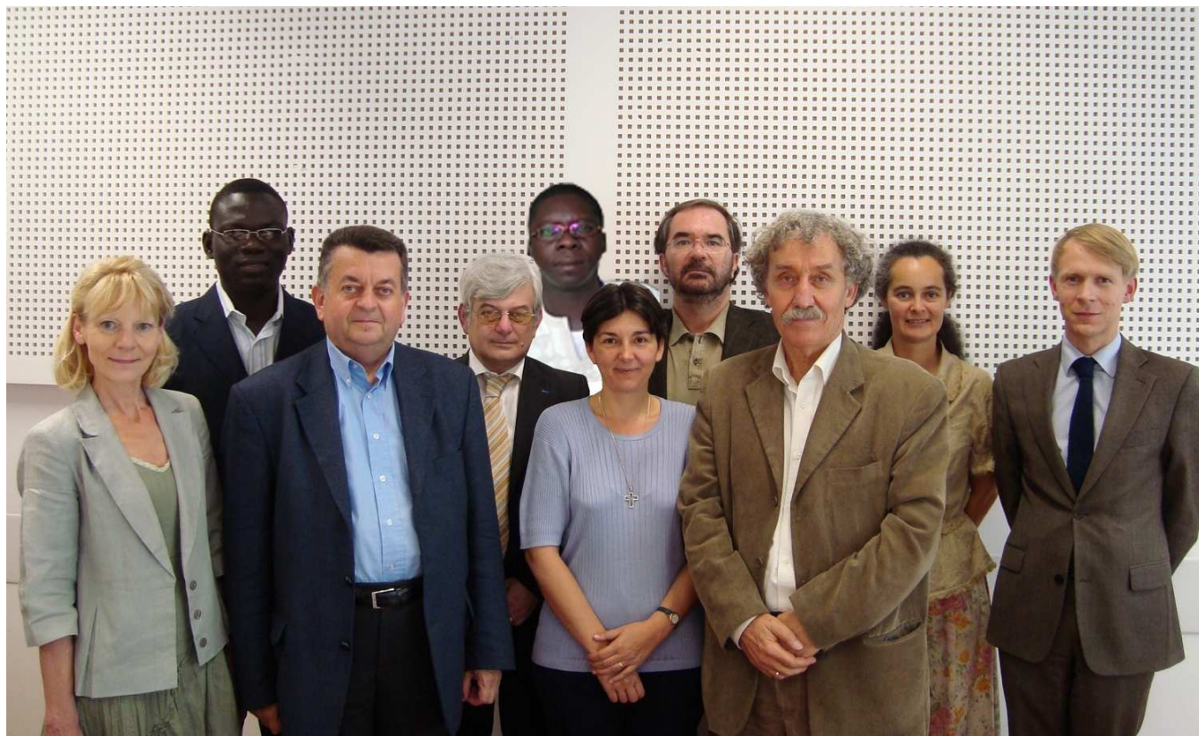
L'équipe de la Chaire Unesco de l'Université Catholique de Lyon

« Mémoire, Cultures et Interculturalité » de l'Université Catholique de Lyon